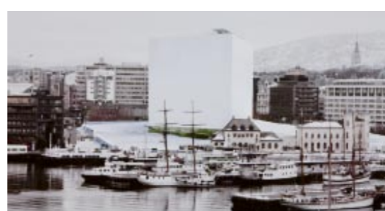
NÅDDE IKKE OPP. Urban Canvas, tegnet av danske Sleth Modernism. Illustrasjon: Trond Isaksen/Statsbygg

Av og til kan man lure på om det hviler en forbannelse over den tomten som Nasjonalmuseet for kunst til enhver tid håper å bebygge. Det gikk galt på Tullinløkka, hver eneste gang. Årsaken lå nok rett og slett i at det ikke var mulig å mobilisere støtte bredt og dypt nok for å bruke et par milli-